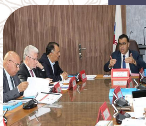
انعقاد الجمع العام العادي لجامعة الغرف المغربية للتجارة والصناعة والخدمات برسم سنة 2026