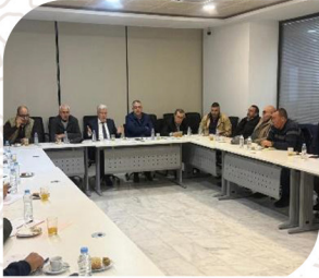
اجتماع المكتب المسير للغرفة مع رؤساء اللجان والأقطاب