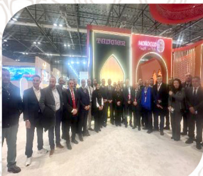
الغرفة تشارك في المعرض "FITUR 2026" الدولي للسياحة