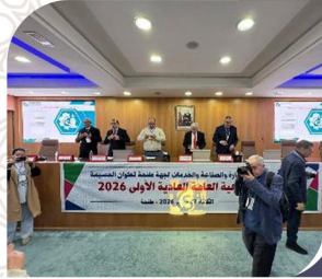
الغرفة تعقد أشغال الجمعية العامة العادية الاولى برسم سنة 2026